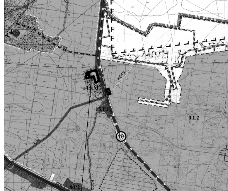
TEREN OBJĘTY MIEJSCOWYM PLANEM ZAGOSPODAROWANIA PRZESTRZENNEGO

Zastrzeżenie, że opracowana mapa może nie zawierać pełnej informacji o przebiegu przewodów podziemnych, których z powodu braku zgłoszenia do geodezyjnej inwentaryzacji powykonawczej, braku danych z instytucji branżowych oraz stosowanych metod pomiaru ujawnienie jest niemożliwe.