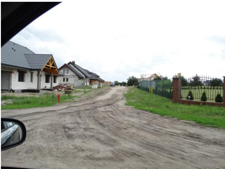
Charakter zagospodarowania wsi Murowaniec – cechy charakterystyczne: duża liczba nowej lub dopiero realizowanej zabudowy, znaczące tereny otwarte pomiędzy zabudową, porośnięte na dużą skalę samosiewiem, podstawą sieci drogowej są drogi gruntowe.