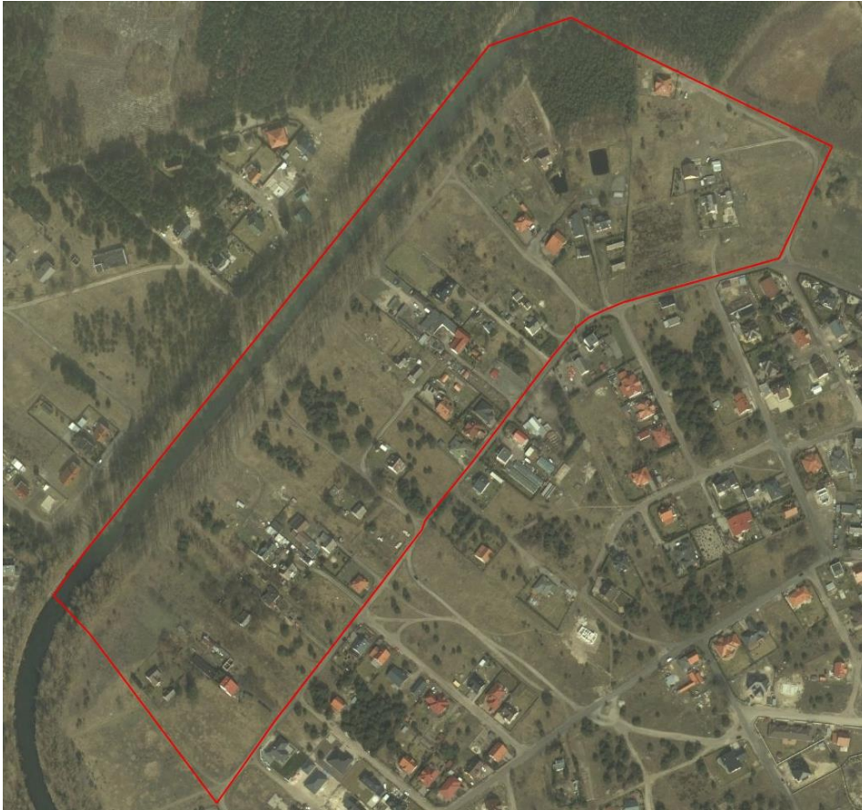
Szczegółowe zagospodarowanie analizowanego terenu.