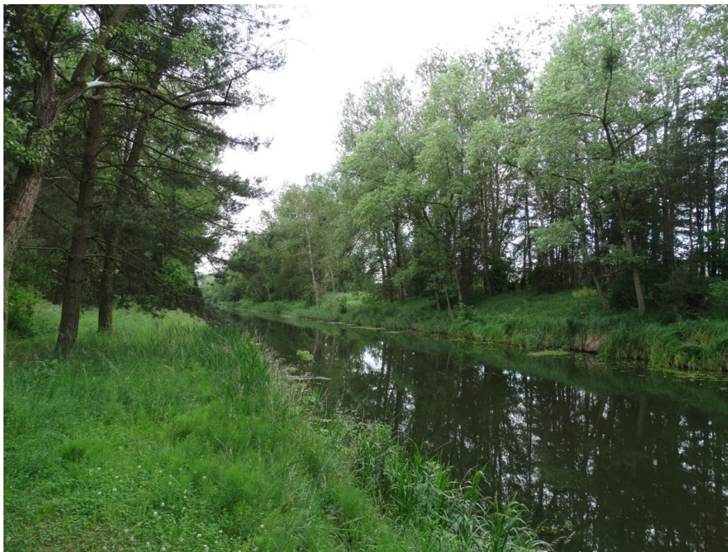
Górny Kanał Notecki – odcinek objęty projektem planu

Zagospodarowanie analizowanego terenu – na kolejnych fotografiach od południa w kierunku północnym. Na pierwszej fotografii widać szpaler drzew liściastych w strefie bezpośrednio przylegającej do Kanału.