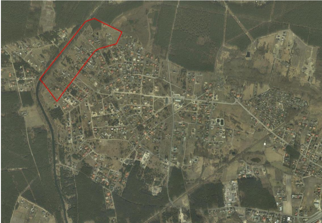
Położenie analizowanego terenu na tle miejscowości Murowaniec.

W północnej części w granicy planu znajduje się teren leśny – las mieszany, będący częścią kompleksu rozciągającego się w kierunku północnym (mający kontynuację poza granicami planu).